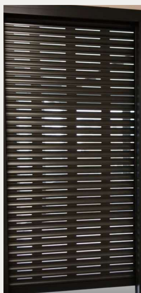
Lame design grand ajour