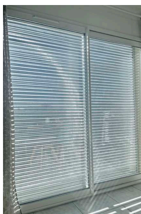
Lame design micro-perforation