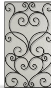
Vitrage imprimé 200 + grille G001