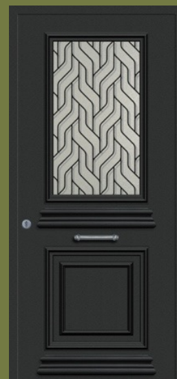
Safira 31 Réf. GCx7 Cimaise décorative extérieure Vitrage imprimé 200 + grille G003 Non réalisable en plaxé