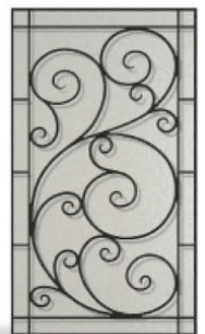
Vitrage imprimé 200 + grille G002