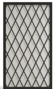
Vitrage imprimé 200 + grille G006