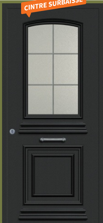
Safira 31 cintre surbaissé Réf. GDU4 Cimaise décorative extérieure Vitrage imprimé 200 + V2 Canon de Fusil Non réalisable en plaxé