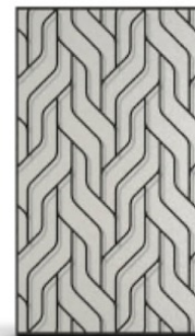
Vitrage imprimé 200 + grille G003