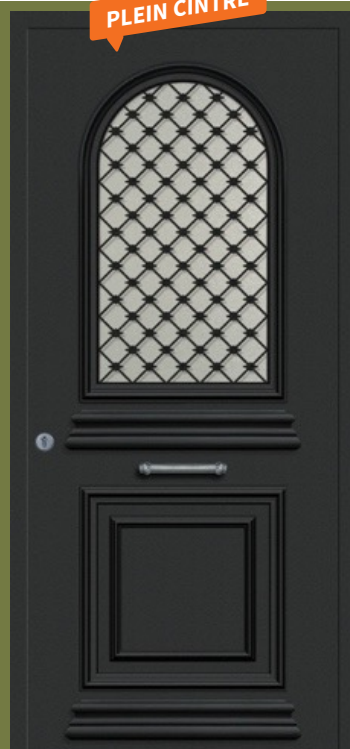
Safira 31 plein-cintre Réf. GCw1 Cimaise décorative extérieure Vitrage imprimé 200 + grille G004 Non réalisable en plaxé